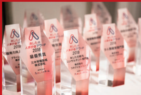
2018年受賞トロフィー

大企業の働き方改革は数多くあれど、中小・ベンチャー企業の事例は少ないのが現状です。そんな中、「残業削減」、「生産性向上」、「離職率改善」、「事業承継」などに成功し、さらに業績アップを実現させた中小・ベンチャー企業の汗と涙の結晶を、受賞企業より各部門ごとに発表していただきます。様々な課題を抱えた企業たちが、どのような背景で、何を行って働き方改革を実現することができたのか？「あしたの人事評価アワード 2019 Book」を通じて、事例を交えながら参加者全員で考えていきます。